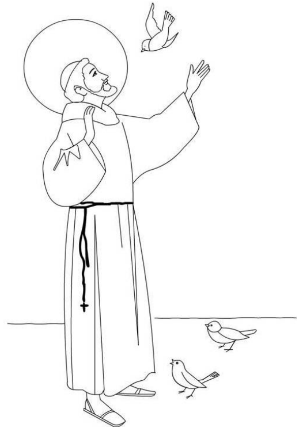
Saint Francois d'Assise