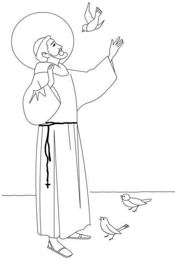
Saint Francois d'Assise